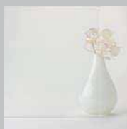
ULTRACLEAR FLOAT GLASS