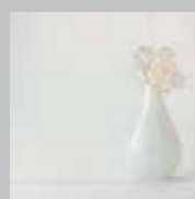
ULTRACLEAR FLOAT GLASS